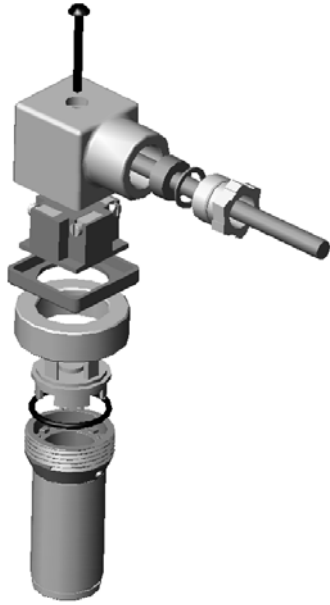
Figura 1 - Esploso connettore